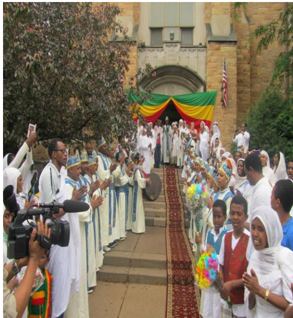
በውጭም በቤትም ሰው ተጥለቀለቀ፤ የሥላሴን መምጣት ፍጥረት ሰለወቀ።

አሁን ሁሉ አለፈ የአንተ እጅ ገባና፤ ዲያብሎስ አፈረ ኤልሻዳይ ነህና። ስድስት ነገሮችን እግዚአብሔር ይጠላል፤ ሰባተኛውን ግን እጅግ ይጸያፋል። ያልተጻፈ አንብበው ሐሰት እያወሩ፤ በወዳጆች መኃል ጥላቻን የዘሩ፤ እንደ ሁለት አይደለም ቁጥራቸው ብዙ ነው፤ አምላክ ነቢያት ልቦና ሰጣቸው። እኛስ ተደሰትን እንባችን ታበሰ፤ በቅዱስ ቤትህ ላይ ሃይማኖት ነገሠ።