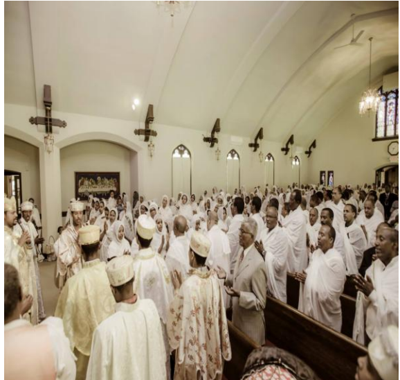
ተመስገን ብለናል ዛሬም ለዘላለም፤ ይኼን ያደረገ ይክበር መድኃኔዓለም።

ዳግማዊ ትንሣኤ በዓሉ ሲክበር ካለሀበት ቦታ፤ ቡራኬህ ደርሶናል የላከው ሰላምታ